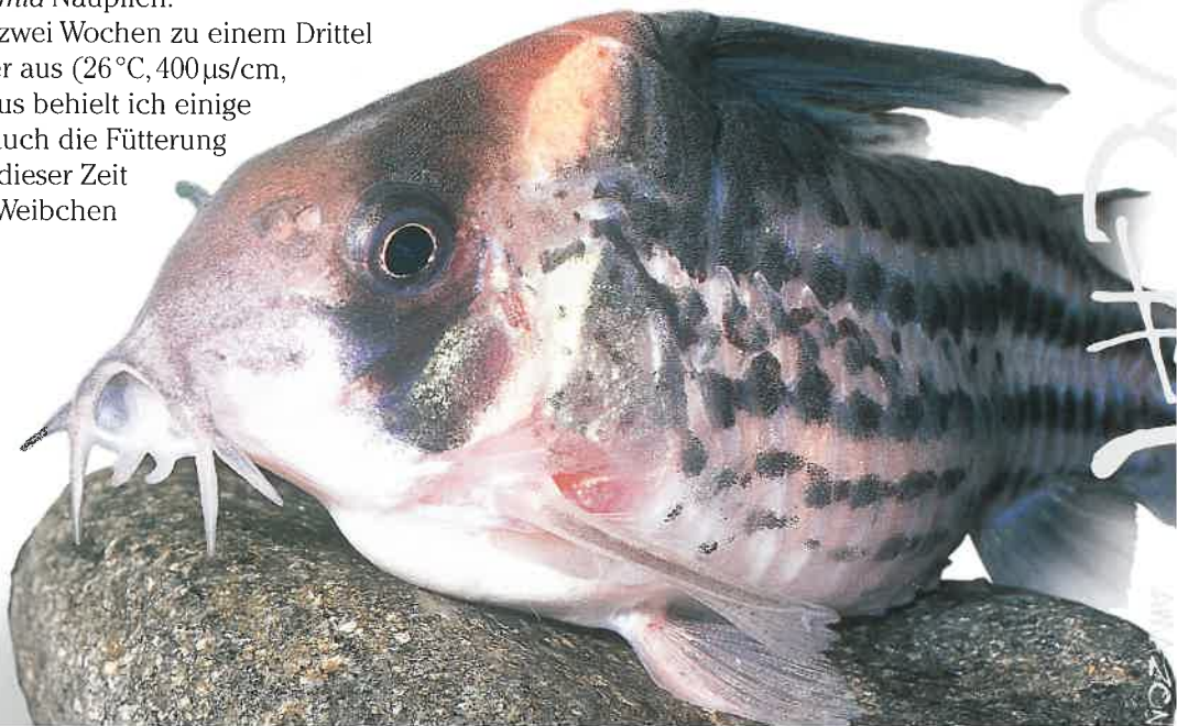
Porträt eines bis zum Bersten mit Laich vollen Weibchens von Corydoras parallelus .

Das Wasser tauschte ich alle zwei Wochen zu einem Drittel gegen frisches Leitungswasser aus (26°C, 400µs/cm, 12°dGH, pH7,0). Diesen Turnus behielt ich einige Monate bei und veränderte auch die Fütterung kaum. Die Tiere gediehen in dieser Zeit erstaunlich gut und die drei Weibchen wurden zusehends runder.