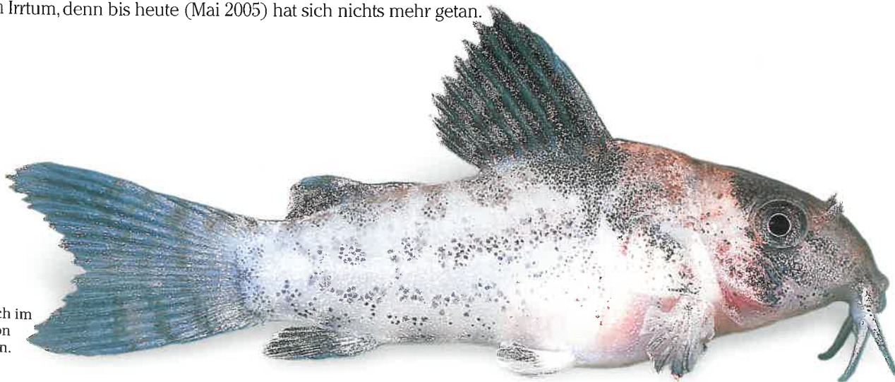
Jungfisch im Alter von 30 Tagen.

Das Ablachen verlief recht ruhig, kaum hektisch. Das Treiben, wenn man es denn so nennen will, wirkte regelrecht entspannt auf mich. Zwei bis drei Männchen schwammen gemächlich die Scheiben hinauf und hinunter. Kam ein Weibchen in die Nähe, schwammen sie es direkt an und tasteten es mit den Barteln von hinten nach vorne ab. Das erfolgreichste Männchen schaffte es bis über den Kopf des Weibchens und stellte sich schließlich in die berühmte T-Stellung. Leider kam ich etwas zu spät und der Höhepunkt war offensichtlich schon überschritten. Auch zogen sich die Protagonisten in die hinteren Beckenbereiche zurück, als sie vom Homo sapiens mit der blitzenden Kamera in der Hand gestört wurden. Ich hoffte darauf, dass die Tiere nun wohl regelmäßig ablaichen würden. Leider war das ein Irrtum, denn bis heute (Mai 2005) hat sich nichts mehr getan.