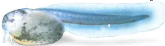
Frisch geschlüpfter Jungfisch mit großem Dottersack.

Tja, und da waren meine Gestreiften gerade dabei, die letzten Eier an die Einrichtungsgegenstände und Scheiben zu kleben!