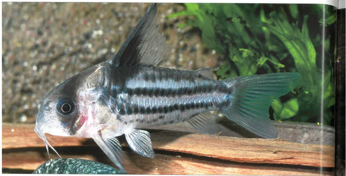
Wildfangmännchen von Corydoras parallelus .