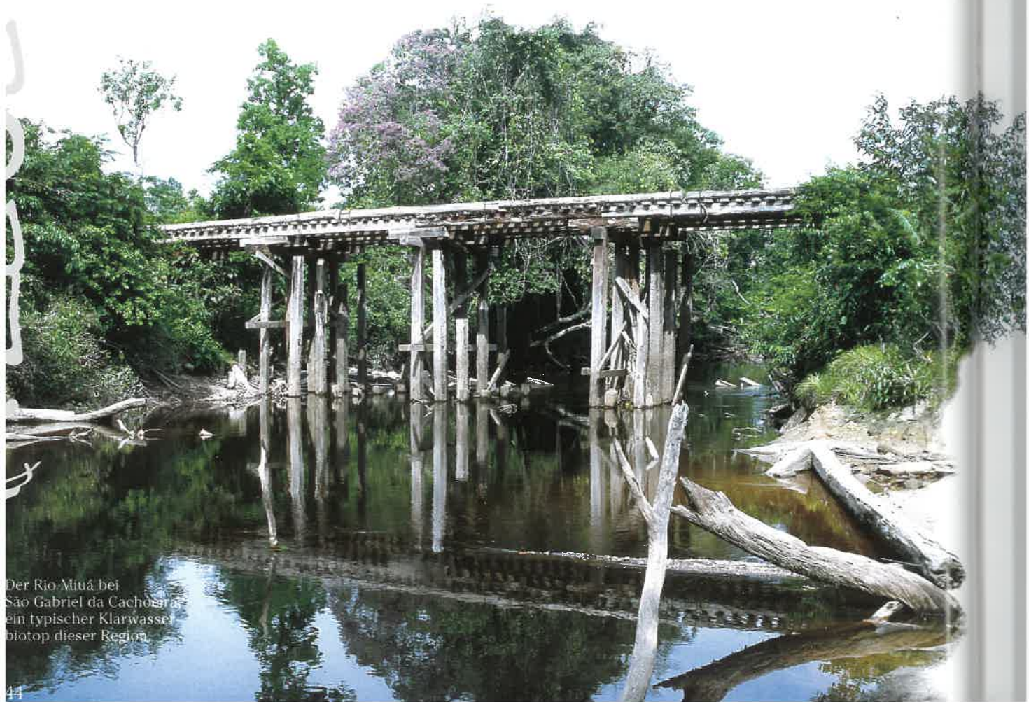
Der Rio Miuá bei São Gabriel da Cachoeira ein typischer Klarwasser- biotop dieser Region