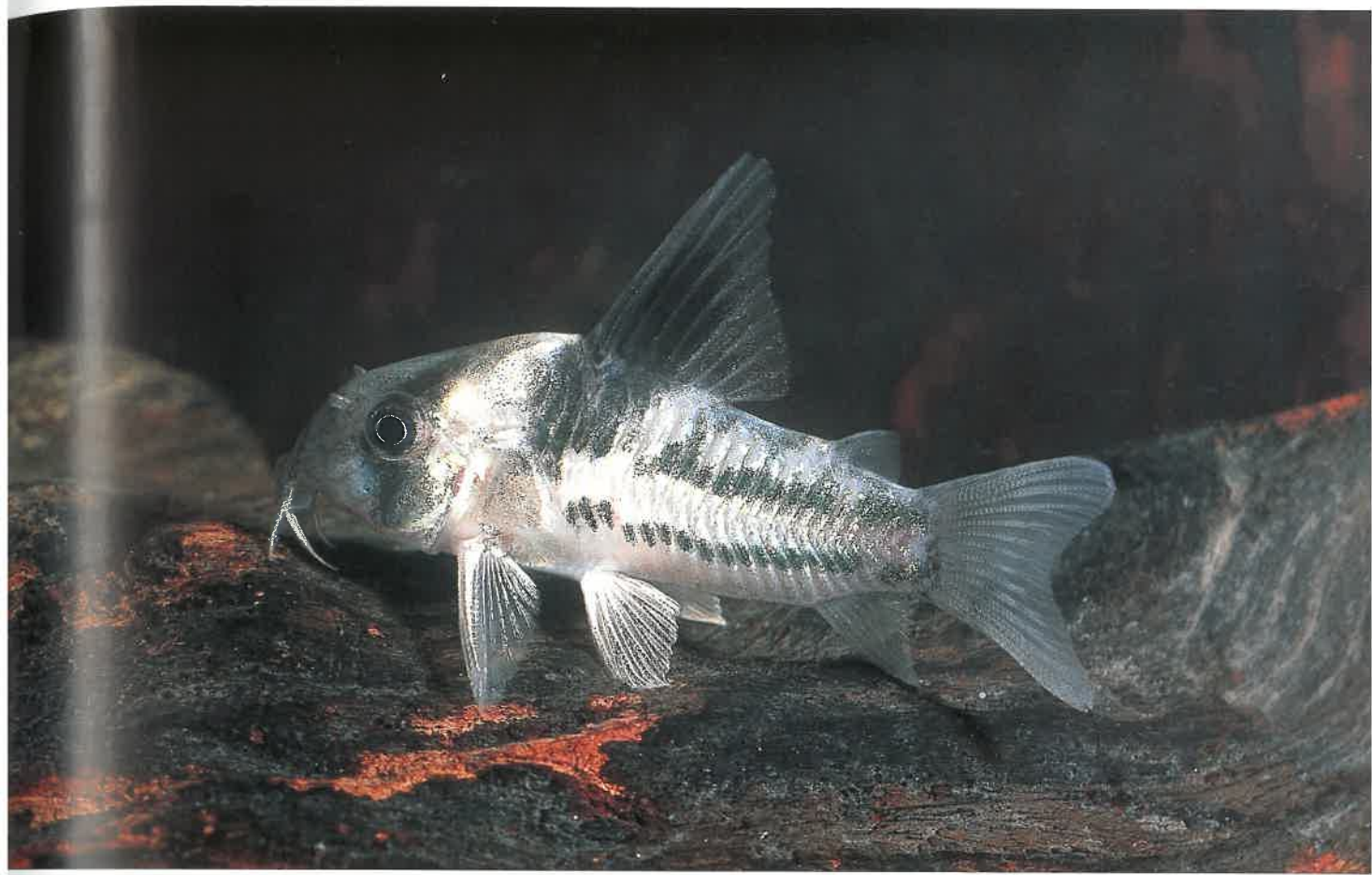
Derartig ungewöhnlich gezeichnete Exemplare sind selten.

Das Ablachen verlief recht ruhig, kaum hektisch. Das Treiben, wenn man es denn so nennen will, wirkte regelrecht entspannt auf mich. Zwei bis drei Männchen schwammen gemächlich die Scheiben hinauf und hinunter. Kam ein Weibchen in die Nähe, schwammen sie es direkt an und tasteten es mit den Barteln von hinten nach vorne ab. Das erfolgreichste Männchen schaffte es bis über den Kopf des Weibchens und stellte sich schließlich in die berühmte T-Stellung. Leider kam ich etwas zu spät und der Höhepunkt war offensichtlich schon überschritten. Auch zogen sich die Protagonisten in die hinteren Beckenbereiche zurück, als sie vom Homo sapiens mit der blitzenden Kamera in der Hand gestört wurden. Ich hoffte darauf, dass die Tiere nun wohl regelmäßig ablaichen würden. Leider war das ein Irrtum, denn bis heute (Mai 2005) hat sich nichts mehr getan.