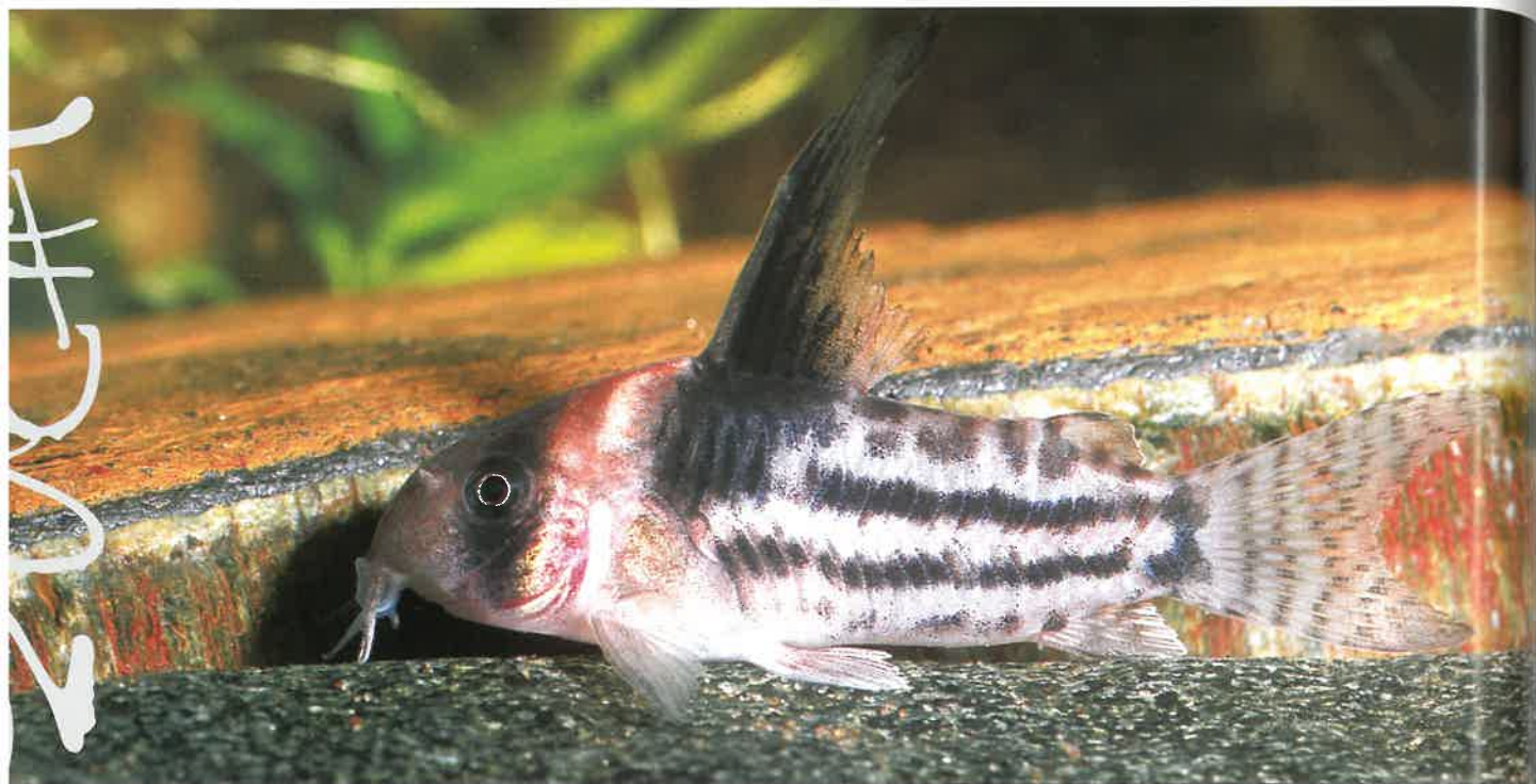
Jungfisch von Corydoras parallelus im Alter von drei Monaten. Bei diesem jungen Männchen ist die Rückenflosse herrlich hoch!