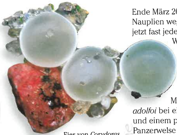
Eier von Corydoras parallelus an der Frontscheibe.

Ende März 2004 begann ich die Fütterung umzustellen. Ich ließ die Artemia -Nauplien weg und verfütterte neben den obligatorischen Wasserflöhen jetzt fast jeden Tag gefrorene rote Mückenlarven. Mitte April stellte ich die Wasserwechsel ein und reduzierte zusätzlich auch die Fütterung. Die Wassertemperatur betrug im Mittel 26°C. Bisher hatte ich das Wasser noch nicht enthärtet. Ich kannte jedoch die heimischen Wasserwerte des Parallelstreifen-Panzerwelses, wusste ich doch aus eigener Anschauung, dass das Wasser im Gebiet des oberen Rio Negro extrem weich ist. So traf ich 1997 im Rio Miuá 54 km nördlich von São Gabriel da Cachoeira Corydoras adolfoi bei einem Leitwert von 6 µs/cm, einer Wassertemperatur von 28°C und einem pH-Wert von pH 5,0 im Klarwasser an. Alle Arten der Orangefleck-Panzerwelse ( C. adolfoi , C. duplicareus , C. nijsseni , C. imitator und andere) leben in diesem Gebiet bei etwa gleicher Wasserbeschaffenheit. Über die Arten des oberen Rio Negro habe ich ja schon an anderer Stelle (EVERS 2002) ausführlich berichtet. Für Corydoras parallelus legte ich ebenfalls diese Werte zugrunde, auch wenn wir über die Biotope der Art noch nichts Näheres wissen.